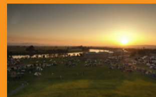
しんしのつ公園キャンプ場の夕陽