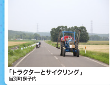
「トラクターとサイクリング」 当別町獅子内