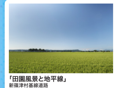
「田園風景と地平線」 新篠津村基線道路