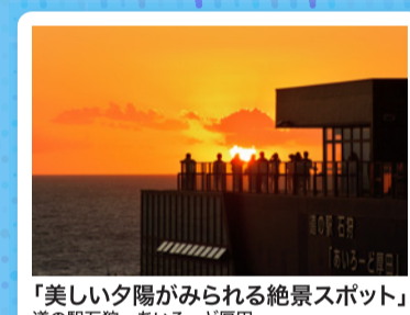
「美しい夕陽がみられる絶景スポット」 道の駅石狩「あいろーど厚田」